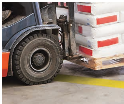
Kein Abschälen unter Gabelstaplerverkehr

Das dicke Trägermaterial sorgt für ausgezeichnete Abriebfestigkeit und hält selbst der Beanspruchung durch Staplerverkehr und Verschieben von Paletten stand. Es ist beständig gegen Feuchtigkeit, Reinigungsmittel und vielen im Industrieumfeld gängigen Chemikalien.